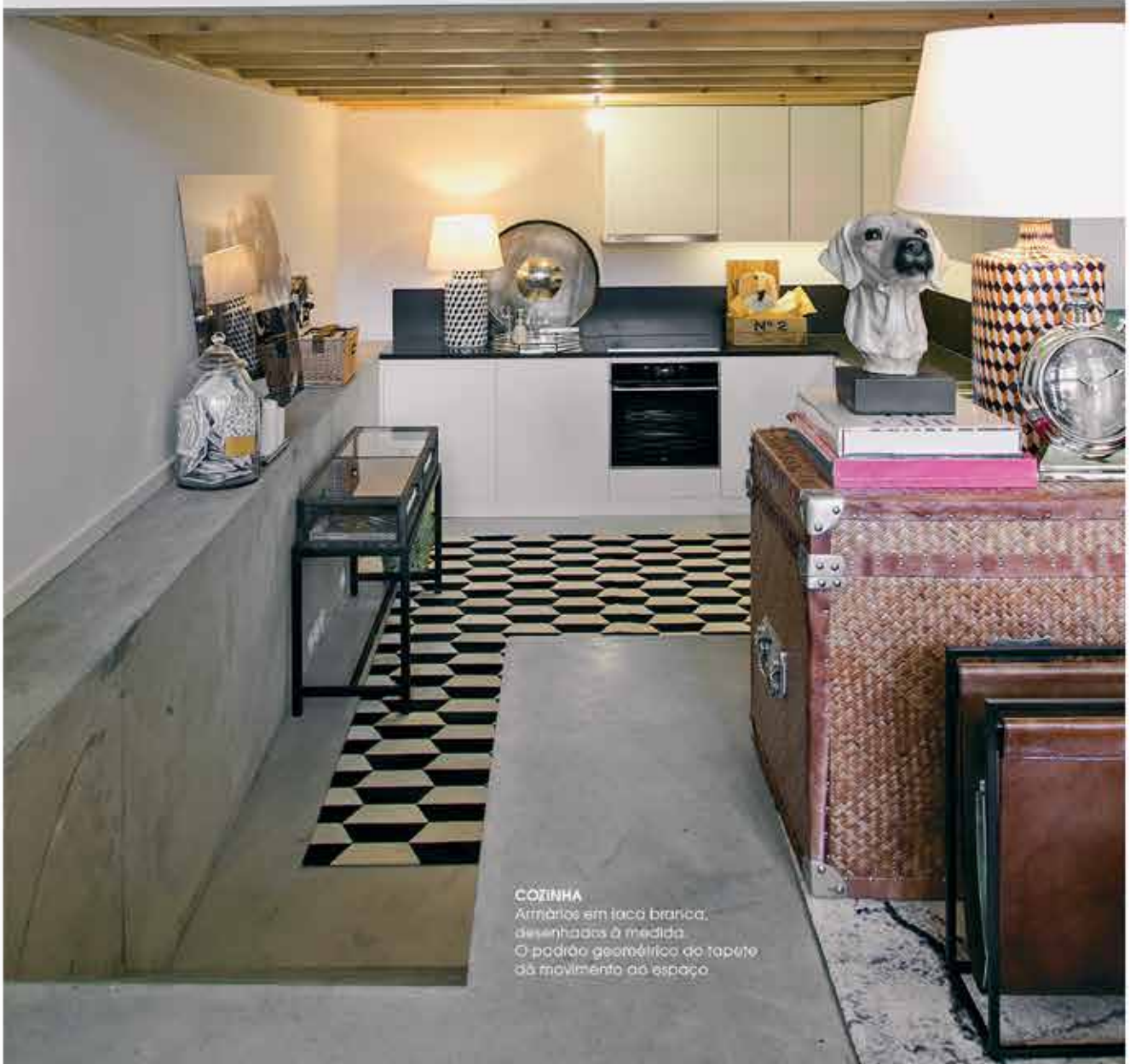
COZINHA Armários em taca branca, desenhados à medida. O padrão geométrico do tapete dá movimento ao espaço